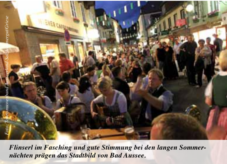
Flinslerl im Fasching und gute Stimmung bei den langen Sommernächten prägen das Stadtbild von Bad Aussee.