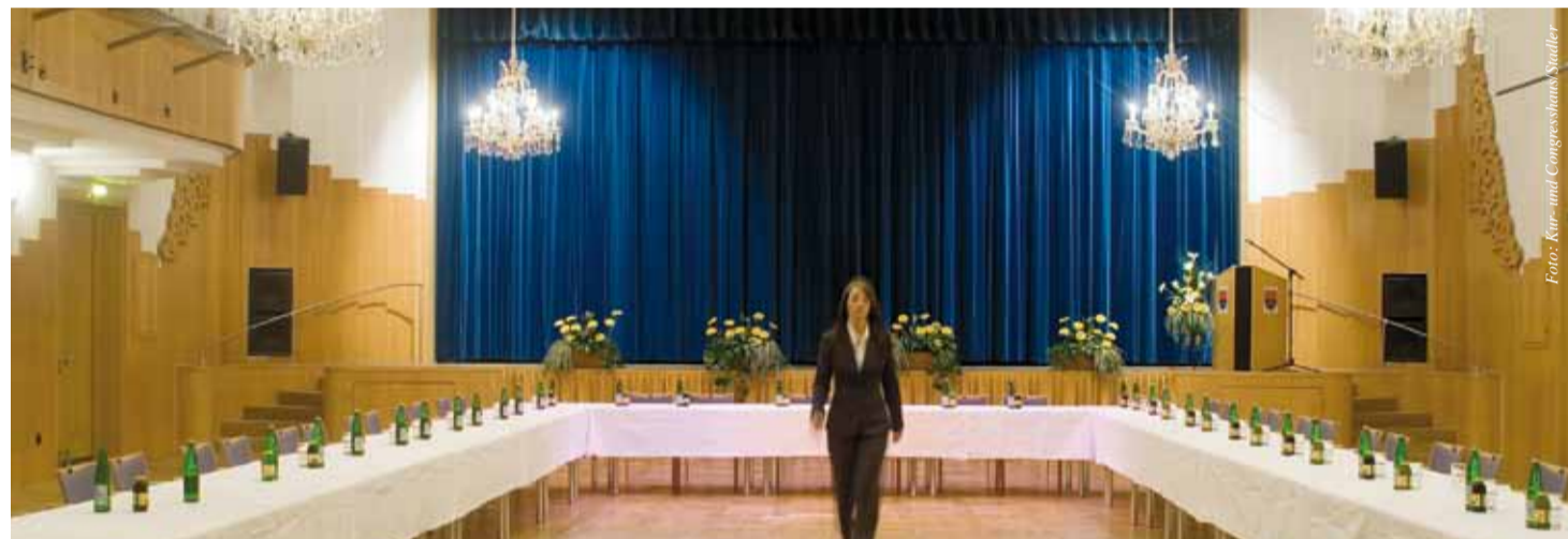
Der Congress Saal im Kur- und Congresshaus Bad Aussee eignet sich für Tagungen, Incentives, Kongresse und Events.

Neben der Qualität der Vorträge und Workshops im Kur- und Congresshaus schätzen die Kongressteilnehmer das tolle Ambiente des Veranstaltungsortes. „Viele kommen später noch einmal auf Urlaub ins Ausseeerland-Salzkammergut zurück“, berichtet die Tourismusexpertin. Der ÖGVT-Kongress wird heuer bereits zum neunten Mal ausgetragen.